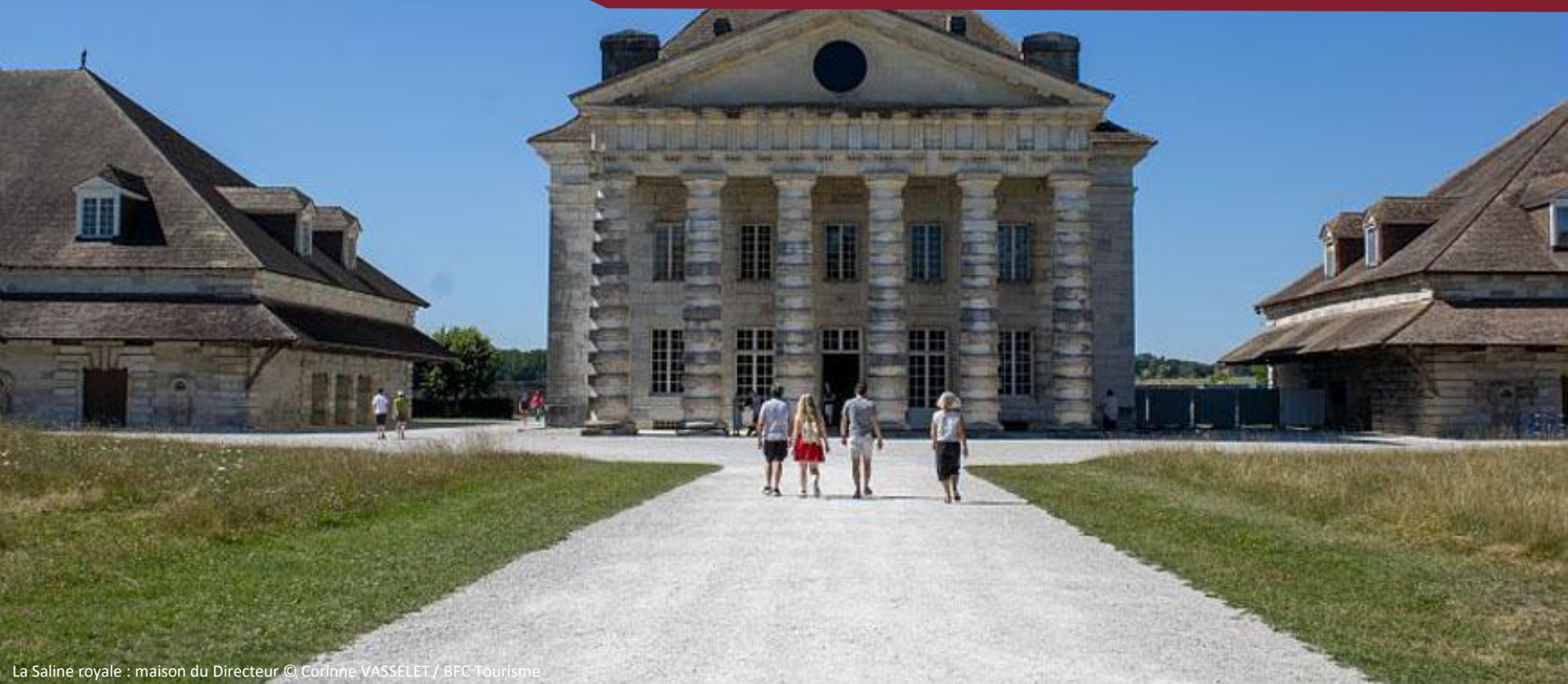
La Saline royale : maison du Directeur

I Saline Royale d'Arc-et-Senans - Grande Saline de Salins-les-Bains